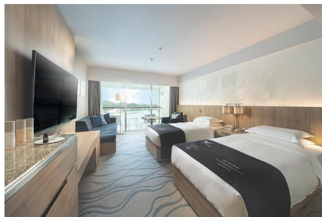
② デラックスツイン（コーストビュー）