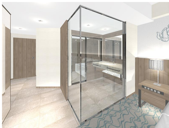
デラックスツイン・バスルーム