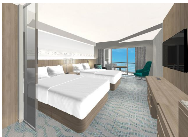
ルネッサンスツイン