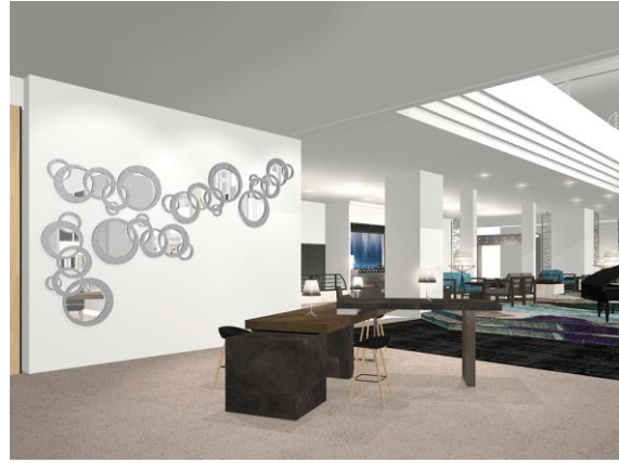
ディスカバリーテーブル