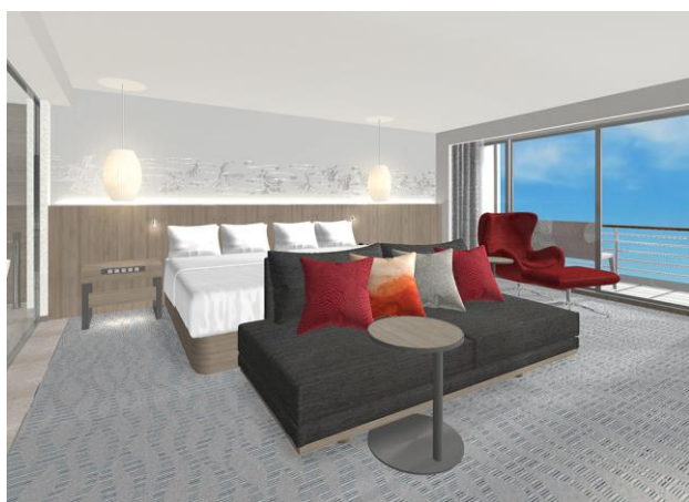
ジュニアスイート