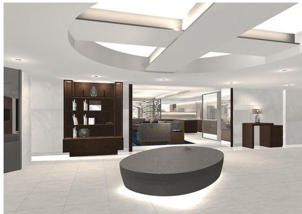
11 階ルネッサンスフロア