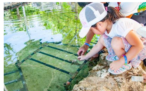
サンゴ植え付け体験（2018年7月8日）

弊ホテルでは、今後も引き続きサンゴ保全活動において弊ホテルならではの企画を提案、実施していく所存です。